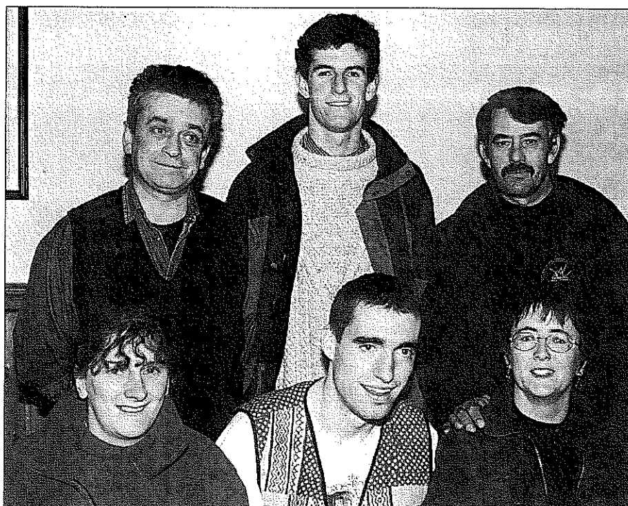
An Deoir Bheannaithe - na haisteoirí

* (Tá an gearrscéal seo sa leabhar 'Gleann an Chuain' atá foilsithe ag Clódhanna Teo.)