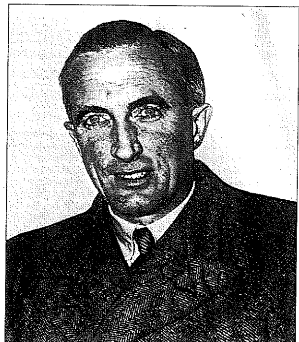
An Flaitheartach - tamall maith de bhlianta ina dhiaidh sin.