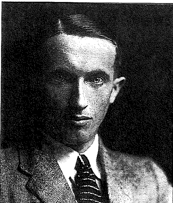
Grianghraf de Liam Ó Flaithearta thart ar an am a scríobh sé Dorchadas .